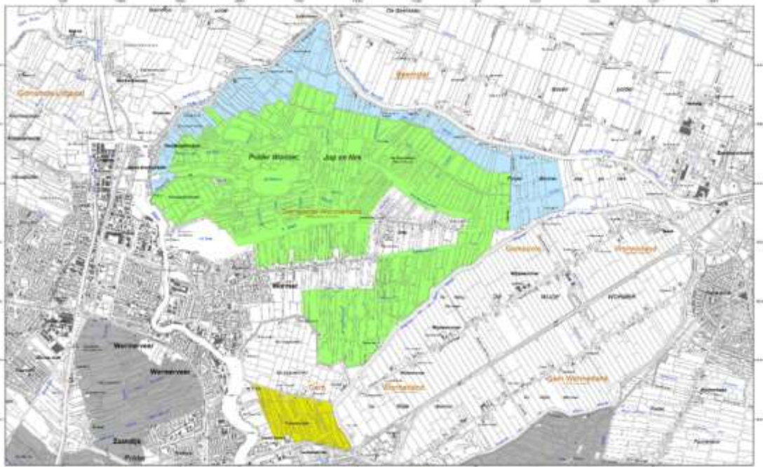
Figuur 1: Begrenzing van het Natura 2000-gebied Wormer- en Jisperveld & Kalverpolder. blauw: Vogelrichtlijngebied (385 ha), geel: Habitatrichtlijngebied (96 ha) en groen: Vogel- en Habitatrichtlijngebied (1357 ha)

Hoofdstuk 2 bevat een toelichting op dit oordeel. In hoofdstuk 3 staan adviezen van de Ecologische Autoriteit voor het provinciale gebiedsprogramma.